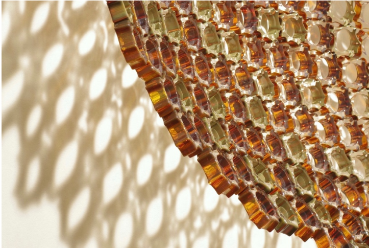
KAGUYA 晶 (深飴葉) / 吹きガラス、溶着 h53×w33×d10cm / 2020 *部分