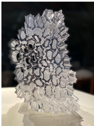
Forest I / 吹きガラス、溶着 / h33×w20×d16cm / 2020