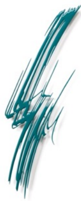
万糸雨 -banshiu- / H110×W40cm / 漆, FRP / 2022