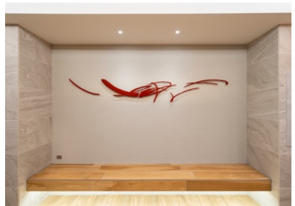
花信風 / 漆, FRP / 2022 / マンション共用スペース (東京)