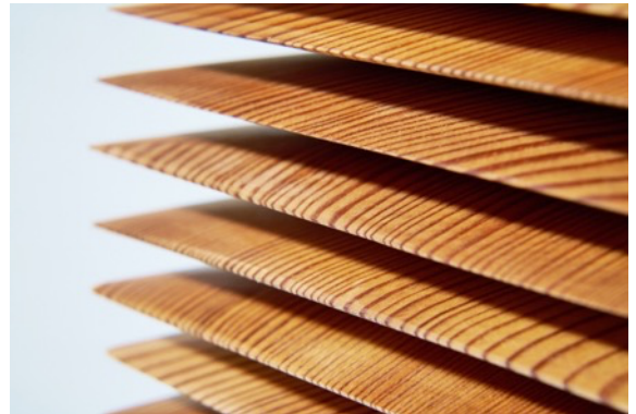
the layer of self / H39×18.5×15cm *部分 Japanese larch (唐松) / 2020