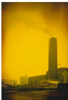
Wharf / Pigment Print, Acrylic Glasses / 60×40×0.9cm / 2014