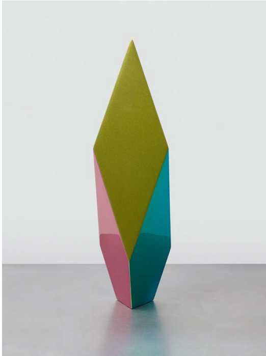
Hanna Roeckle Protostar A-1 / Dichroic Lacquer auf SWISS CDF / 41×11×10cm / 2023