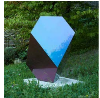
*Currently exhibiting at Sculpture Park in Kunstmuseum Liechtenstein