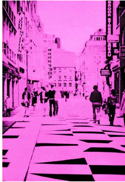
Romeo Vendrame Dedicated Followers II / Pigment Print, Acrylic Glasses / 60×40×0.9cm / 2019