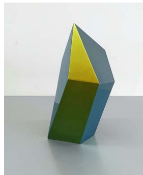
Scuit Greengold / Dichroic Lacquer and SWISS CDF / 37×12×20cm / 2021-22