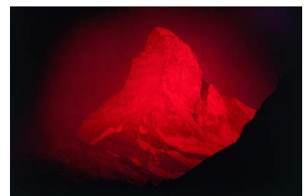
Urqu - from the series Berg / Pigment Print, Acrylic Glasses / 20×30×3.3cm / 2009