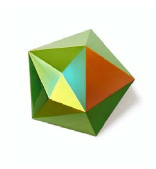
Antares / Dichroic Lacquer and SWISS CDF / 60×60×12cm / 2023